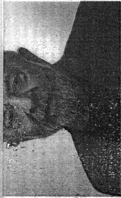
O presidente eleito viajou na última terça (1ª) à Bahia para descansar e chegou sábado (5) a São Paulo

ampia base no Congresso, garantir espaço no Orçamento para viabilizar programas prometidos na campanha, definir os nomes do novo ministério e estreitar laços com atores internacionais. Esses objetivos são elencados por aliados do petista que encerrou folga tirada após a eleição - como algumas das primeiras missões que terá antes de assumir o cargo.