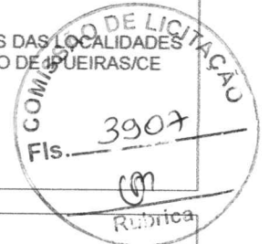
TABELA FONTE: SEINFRA/CE - 027.1 - DESONERADA

BDI = 26,75% - ENCARGOS SOCIAIS = 83,85% - 47,76%