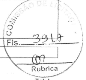
TABELA FONTE: SEINFRA/CE - 027.1 - DESONERADA

BDI = 26,75% - ENCARGOS SOCIAIS = 83,85% - 47,76%