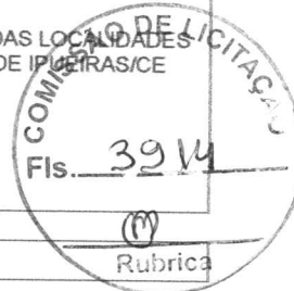
TABELA FONTE: SEINFRA/CE - 027.1 - DESONERADA

BDI = 26,75% - ENCARGOS SOCIAIS = 83,85% - 47,76%